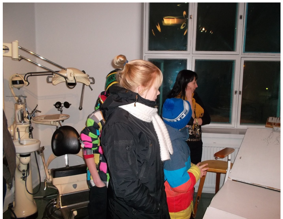
Maaseutunuoria tutustumassa Harjamäen sairaalamuseoon helmikuussa